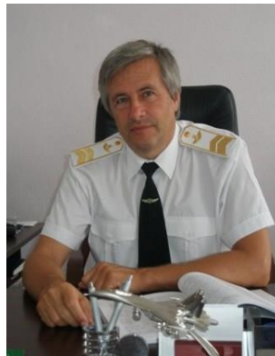
Професор Олександр Запорожець