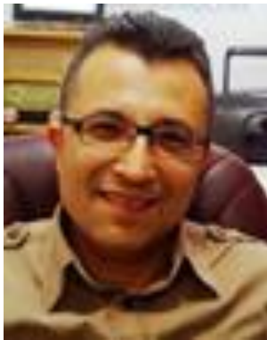
Професор Т. Хікмет Каракоч